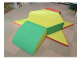
クッション滑り台