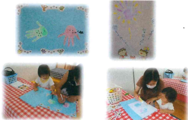
親子で仲良く作品作り。楽しいね♪

可愛い手形・足形が海の生き物や花火に大変身。 この夏の素敵な思い出が詰まった作品ができあがりました！！